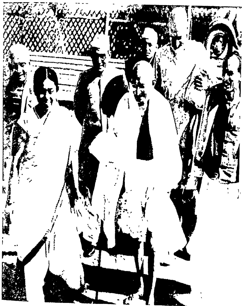
बंठकमें जाते हुए